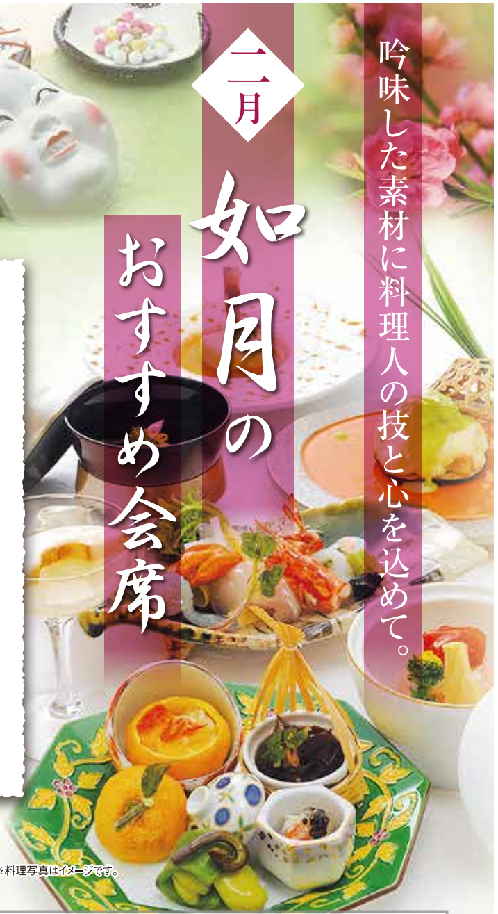
※料理写真はイメージです。